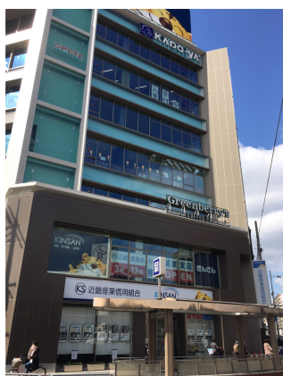
大阪市営地下鉄「蒲生4丁目」駅隣接

私たちが目指す「グリーンベリーズコーヒーのある街」には、様々な世代のお客様の暮らしがあります。お客様を限定せず、暮らしの多様性こそ私たちにとって恵みであり、笑顔の原点であると考えています。それゆえ1日の暮らしにも様々な顔があふれています。朝・昼・午後・夕方・夜…そしてひとりひとりの生活レベルにまで目を向けると、さらに多くの障壁に成り得る環境があるということを知りました。私たちは少しでもお客様が「足を運び易く」「使い易く」そして「話し易い」リラックス&リフレッシュできる環境をつくることです。今回、蒲生4丁目店で新設した「キッズスペース」という発想。グリーンベリーズコーヒーが目指すカフェスタイルを必要とする街がまだまだたくさんあるはず。米国バージニア州で育まれたクラフトマンシップはこういった場所に受け継がれていくと信じています。