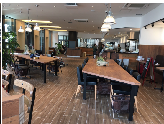
直営店舗最大スペースを持つ店内は様々な用途に合わせてお使い頂けます